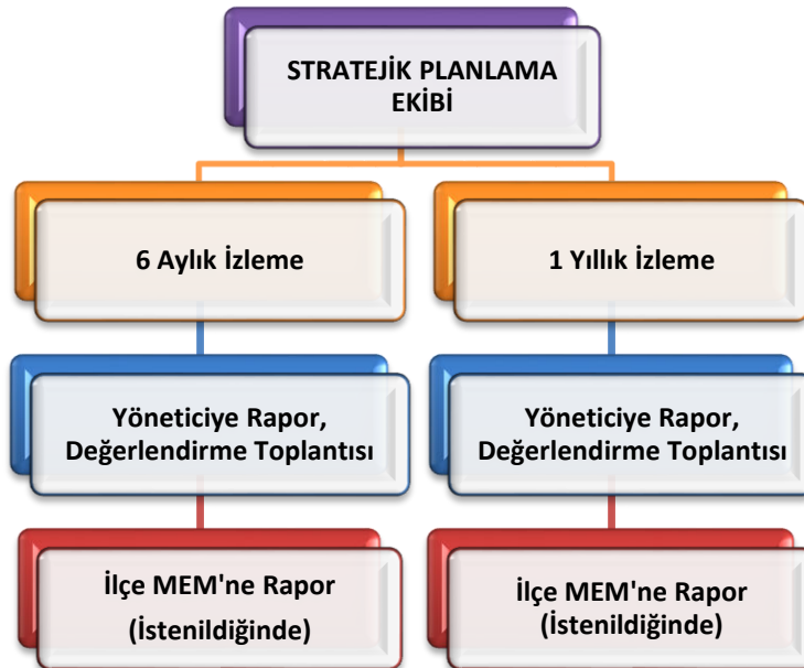
Şekil 2 Stratejik Plan İzleme ve Değerlendirme Modeli

Müdürlüğümüzün 2024-2028 Stratejik Planı İzleme ve Değerlendirme sürecini ifade eden İzleme ve Değerlendirme Modeli hazırlanmıştır. Okulumuzun Stratejik Plan İzleme-Değerlendirme çalışmaları eğitim-öğretim yılı çalışma takvimi de dikkate alınarak 6 aylık ve 1 yıllık sürelerde gerçekleştirilecektir. 6 aylık sürelerde Okul Müdürüne rapor hazırlanacak ve değerlendirme toplantısı düzenlenecektir. İzleme-değerlendirme raporu, istenildiğinde İlçe Milli Eğitim Müdürlüğüne gönderilecektir.