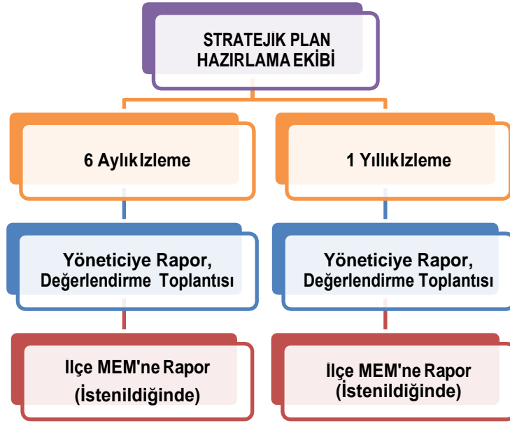
Şekil 2 İzleme ve Değerlendirme Süreci

Müdürlüğümüzün 2019-2023 Stratejik Planı İzleme ve Değerlendirme sürecini ifade eden İzleme ve Değerlendirme Modeli hazırlanmıştır. Okulumuzun Stratejik Plan İzleme-Değerlendirme çalışmaları eğitim-öğretim yılı çalışma takvimi de dikkate alınarak 6 aylık ve 1 yıllık sürelerde gerçekleştirilecektir. 6 aylık sürelerde Okul Müdürüne rapor hazırlanacak ve değerlendirme toplantısı düzenlenecektir. İzleme-değerlendirme raporu, istenildiğinde İlçe Milli Eğitim Müdürlüğüne gönderilecektir.